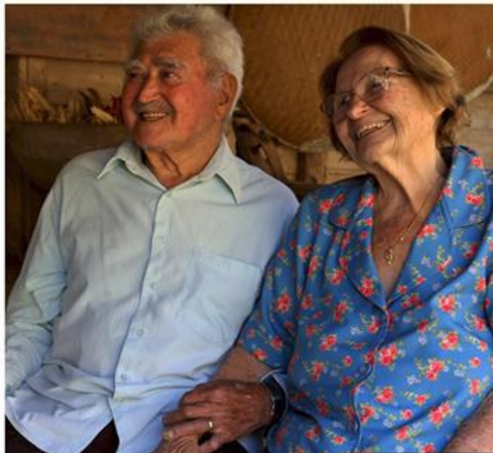
Imigração Italiana ganha lançamento de documentário nesta quarta (27) em seminário de turismo | Imagens: Divulgação

Tutti Buona Gente – A saga italiana nas Montanhas Capixabas. Esse é o título do videodocumentário que será lançado oficialmente nesta quarta-feira (27), durante o VI Seminário de Fortalecimento do Turismo nas Montanhas Capixabas, que este ano será realizado no município de Venda Nova do Imigrante.