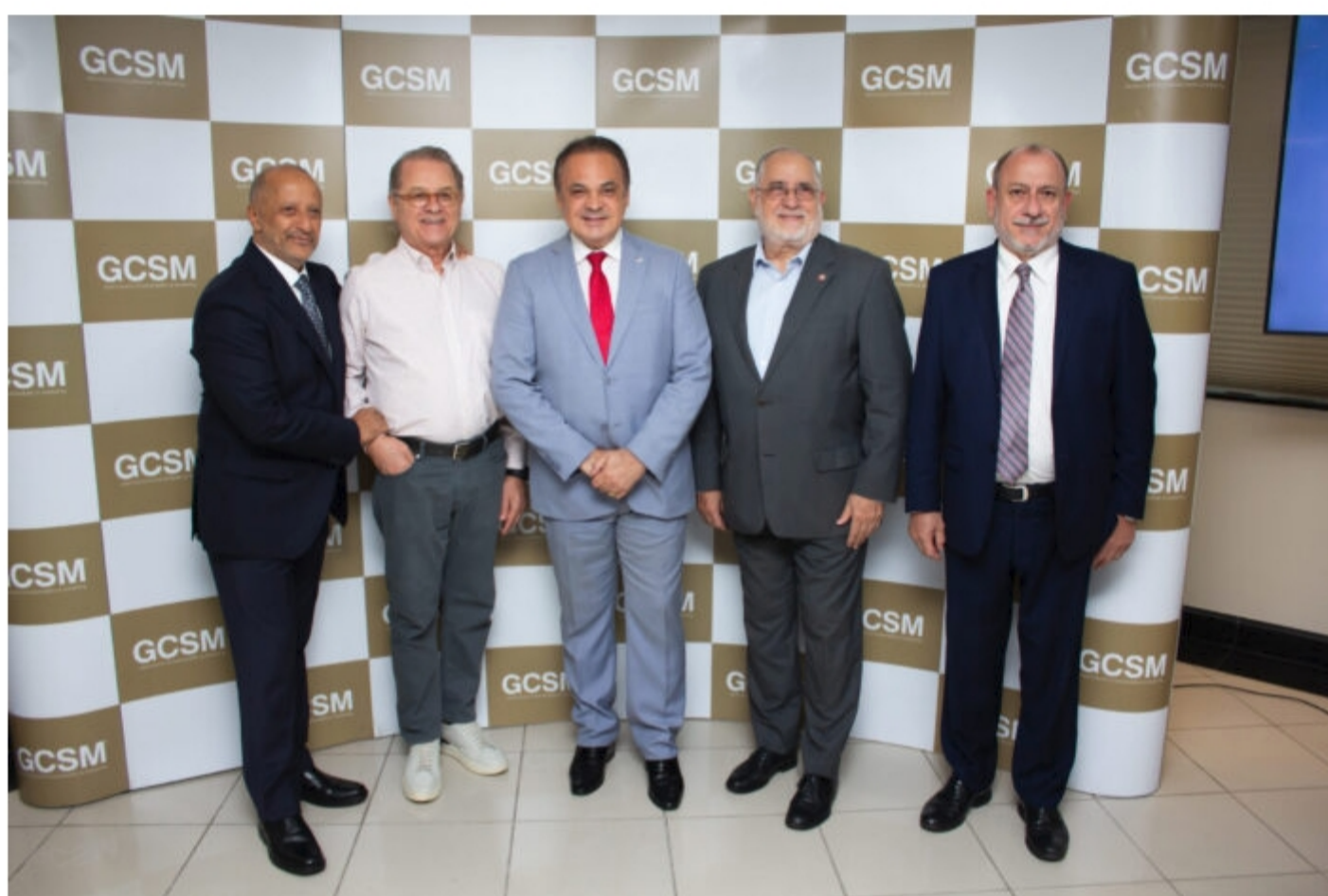
Presidente do Visite São Paulo Convention Bureau diz que transporte e promoção do destino são essenciais para o turismo