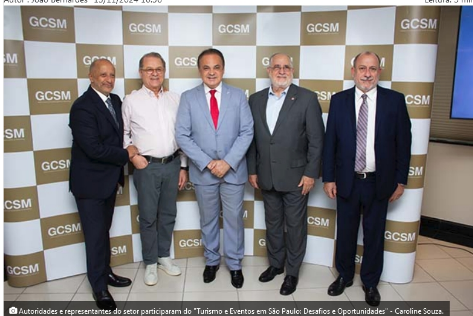
Autoridades e representantes do setor participaram do "Turismo e Eventos em São Paulo: Desafios e Oportunidades" - Caroline Souza.