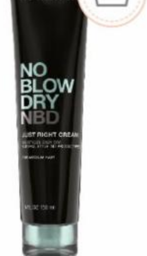
No Blow Dry, R$ 134, Redken