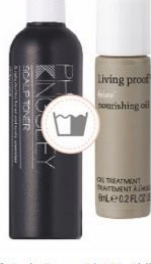
Nourishing Oil, R$ 150, Living Proof; Scalp Toner, R$ 100, Philip Kingsley

A água micelar, queridinha do skincare, ganha versão capilar. A fórmula remove as partículas de sujeira do fio, mas mantém os óleos naturais do cabelo. No departamento hidratação, surge um novo sem enxágue poderoso que vale por um banho de creme de salão – só que feito em casa e a seco. Aí eu vi vantagem!