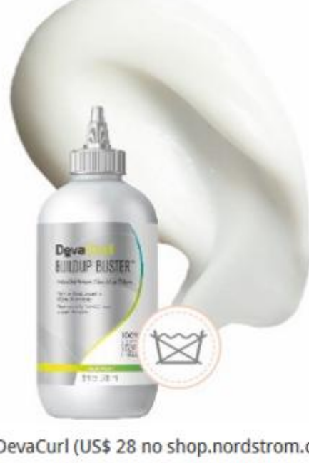
Água micelar Buildup Buster, DevaCurl (US$ 28 no shop.nordstrom.com); Elseve Cicatri Renov, R$ 13, L'Oréal Paris

São os substitutos do secador em forma de leave-in. Com conjunto de moléculas hidrofóbicas (que repelem a água) o lançamento da Redken acelera em até três vezes a secagem do cabelo. O contato do fio com a água é reduzido e o risco de agressão é micro.